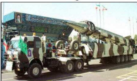
Trägerrakete Shahab 3 mit Zugmaschine während einer Militärparade in Teheran