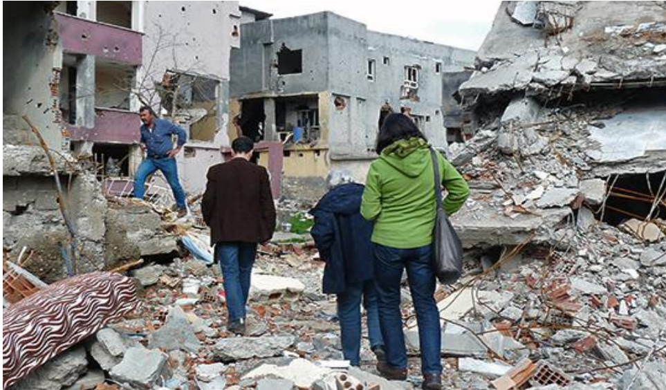
In den Trümmern eines zerstörten Viertels in Cizre.

Ein städtischer Angestellter zeigt uns bei einem anschließenden Rundgang durch die Ruinenlandschaft der am stärksten betroffenen Viertel die Bergstraße, von der aus der Artilleriebeschuss anfangs erfolgte. Erst später seien Panzer und Militäreinheiten eingerückt und hätten einen inneren Belagerungsring um vier Straßenzüge gezogen. Haus für Haus seien sie in die Wohnungen eingedrungen und hätten alles zerstört, was sie noch vorfanden. An den Wänden hinterließen sie Parolen wie „Ihr habt die Kraft der Türken zu spüren bekommen“ oder „Ihr seid alle Huren“.