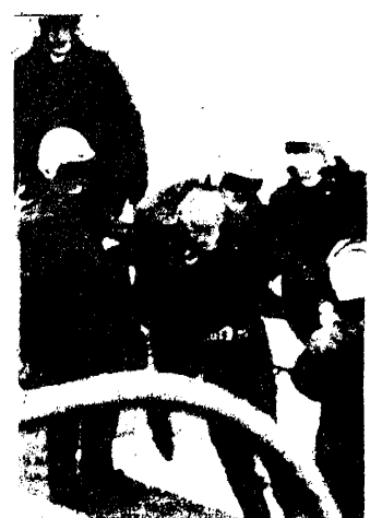
Die beste Rote Hilfe ist die Rote Armee