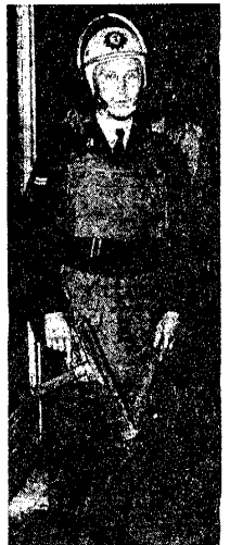
BIS AN FINE ZWINE bewaffnet

UNS FEHLT NICHT DER MUT DIE ZEIT DIE KRAFT DAS GELD DIE MACHT WIR HABEN KEINE ANGST ZU KÄMPFEN DENN DIE FREIHEIT IST UNSER ZIEL. ALLES WAS UNS FEHLT IST DIE SOLIDARITÄT IST DIE SOLIDARITÄT!